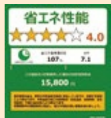
家電の省エネ性能を表す統一省エネラベル