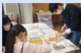
やまカボ・サポーターによるワークショップ

環境を保全し、将来につなげていくための活動に参加してみませんか。学生の環境ボランティア「やまカボ・サポーター」による子ども向けの環境ワークショップなどを各地で開催する予定です。