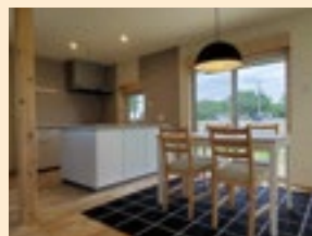
やまがた省エネ健康住宅

省エネを意識し、小まめにテレビや照明を消すなど行動を変えてみましょう。LED照明などの省エネ性能の高い家電への買換えや、窓などの断熱性を高めるリフォームも効果的です。