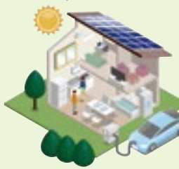
太陽光発電+蓄電池

家庭や事業所に太陽光発電や木質バイオマスなどの再生可能エネルギーを導入してみませんか。また、蓄電池があれば、発電した電気をためることができ、停電時も電気が使えて安心です。