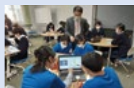
やまがたカーボンニュートラル大使による活動