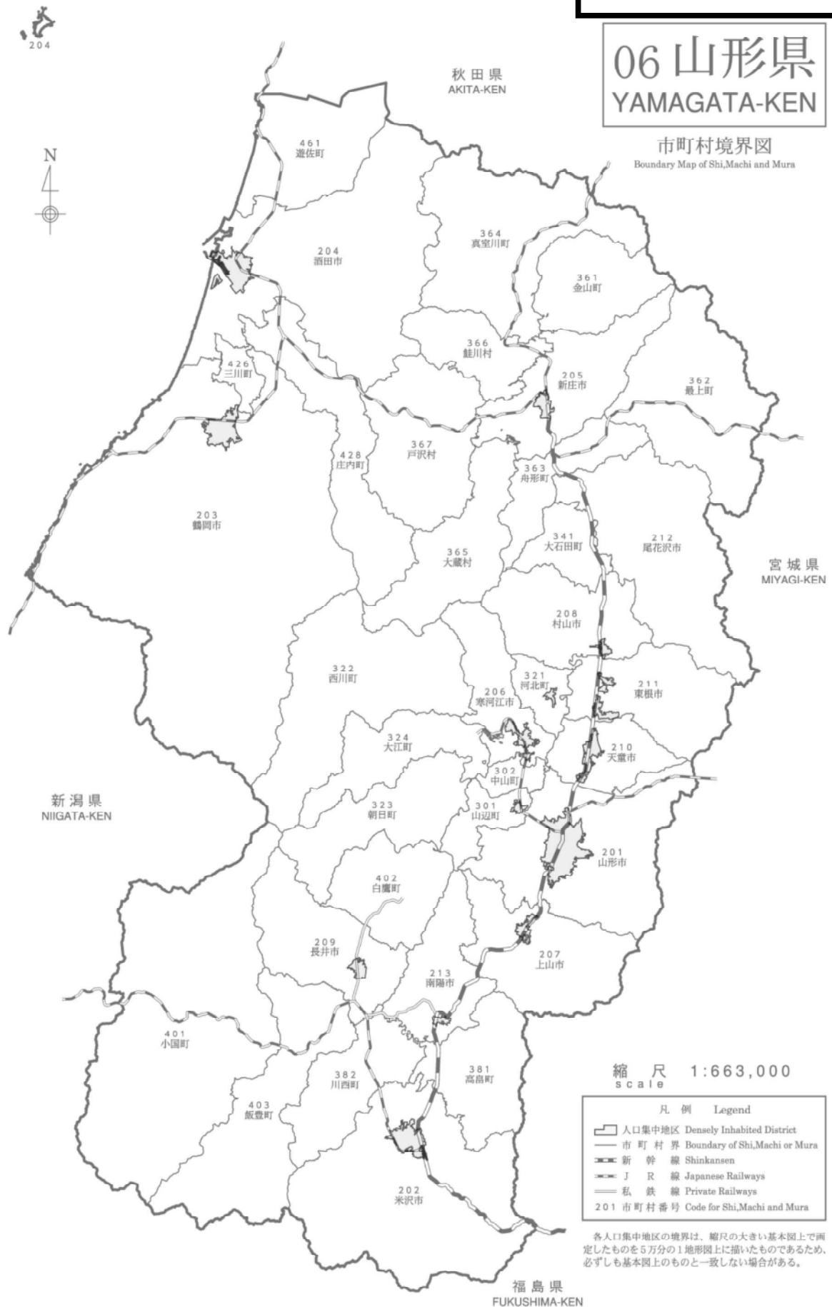
市町村境界図 Boundary Map of Shi,Machi and Mura