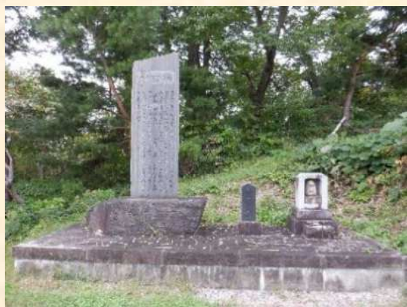
記念碑/おくらの供養碑

また大倉ため池では、フットパスを利用したイベントの開催や、消防団の水難訓練など、様々な活用がされ、農業用ため池としての役割だけでなく、地域の憩いの場や、暮らしに欠かせない場所となっている。