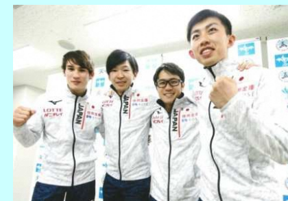
2018 平昌冬季五輪での活躍期待 スピードスケート日本代表に選出された本県にゆかりのある4選手