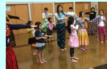
総合型地域スポーツクラブ活動の充実 幼児期からの親子ダンス教室