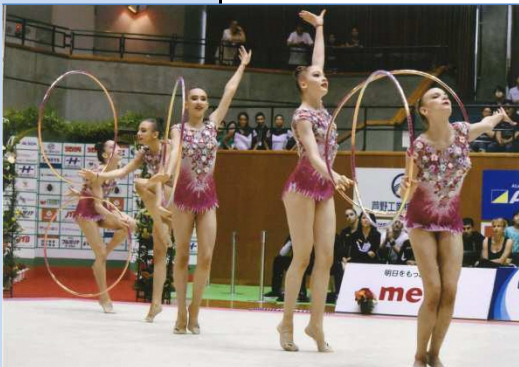
2020 東京五輪ホストタウンへの取組み ブルガリア新体操チーム事前キャンプ (H29. 6. 14~28 村山市)