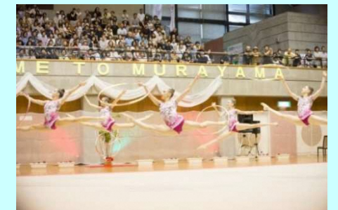
2020 東京五輪ホストタウンへの取組み ブルガリア新体操チーム事前キャンプ(H29.6.14~28 村山市)