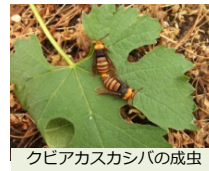
クビアカスカシバの成虫