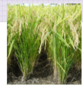
有望早生系統の稲姿