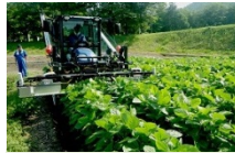
摘心機による処理