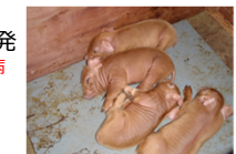
マット保温による 子豚の温度管理