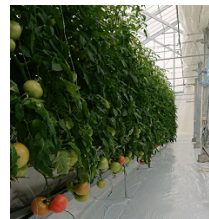
次世代型施設のトマト