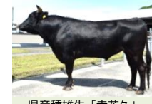
県産種雄牛「幸花久」