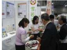
アグリビジネス創出 フェアでPR