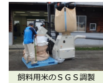
飼料用米のS G S調製