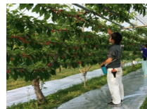
おうとうの新たな樹形 「Y字」仕立て