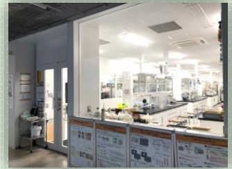
建てて2年程の新しい実験室での分析