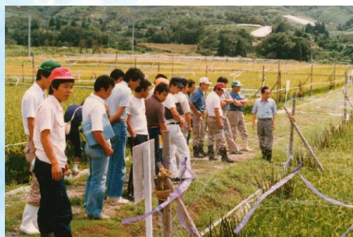
水稻安定栽培技術を地元農業青年が学ぶ(昭和56年頃)

当産地研究室は、次の100年に向け置賜地域における野菜・花きの生産振興と産地発展を目指して試験研究に取り組んでいきます。