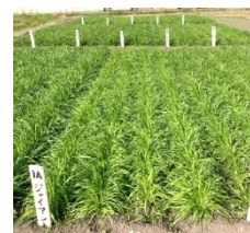
◆イタリアンライグラス