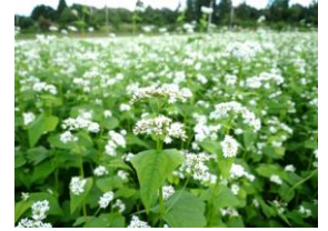
本県育成の新品種「山形 BW5号」

今後も“そば処やまがた”のさらなる活性化につながる新品種開発に取り組んでいきます。