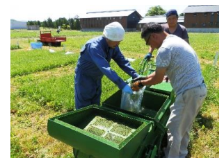
収量調査：プロットハーベスタでの刈取