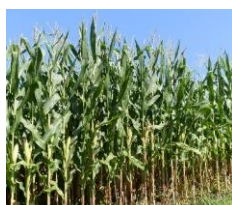
◆飼料用とうもろこし