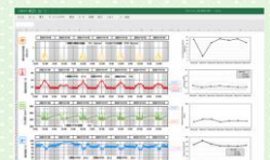
環境データ1週間分の集計グラフ