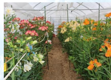
アルストロメリアほ場(令和3年)