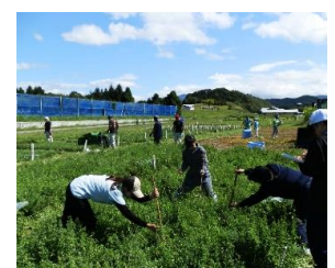
生育調査：草丈の測定

近年では、平成30年度から令和2年度の3年間で、飼料用とうもろこし3品種と牧草4品種を県有望品種に選定しました。