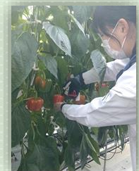
パプリカの収穫調査の様子

長期研修で学んだ、環境制御の考え方と収量構成要素に関する理論を活かして、現場に役立つ研究技術開発や普及に取り組んでいきたいです。