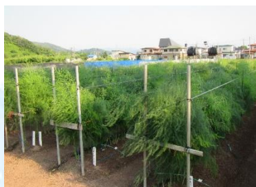
アスパラガスほ場(令和3年)