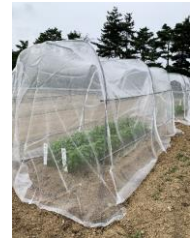
交雑を行う小型ハウス