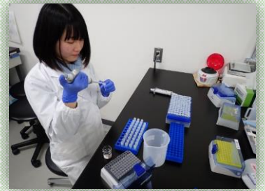
代謝成分の抽出作業

今後は研修で学んだ研究スキルや心構えを生かして、県の農業研究とメタボローム解析の橋渡しをしつつ、より発展させられるよう努めたいと思います。