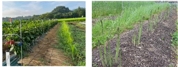
野菜の有機栽培（左：緑肥活用 右：アスパラガス有機栽培）

そこで、主要品目の有機野菜の収量向上を図るため、「施肥技術構築等による有機野菜栽培技術の開発」に取り組んでいます。具体的には、バイオマスプラント副産物である肥効の高い「メタン発酵消化液」活用や野菜の有機栽培技術の開発等について検討します。