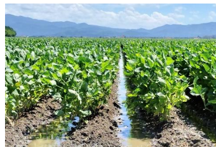
大豆のうね間灌水

本研究では、地理・土壌の情報と気象データを基に土壌水分量を推定し、灌水の適期を診断する情報システム「大豆灌水支援システム」を山形県内で検証し、うね間灌水を行った場合の増収効果を明らかにします。この「大豆灌水支援システム」を活用し、干害を軽減することにより大豆の増収を目指します。