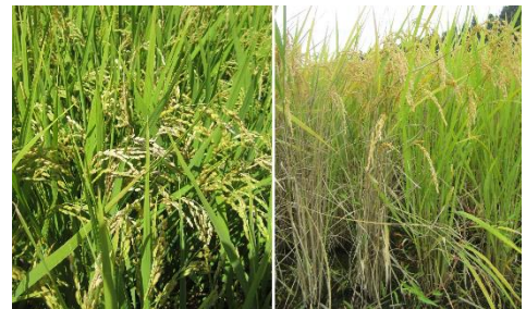
いもち病（穂いもち、左）と紋枯病（右）

そこで、いもち病や紋枯病の温暖化条件下での発生に及ぼす気象要因や農薬の作用等を解析し、いもち病圃場抵抗性遺伝子の活用や紋枯病の防除要否判断基準の作成等を行い、SDGsの達成にも貢献する水稻主要病害の防除体系を構築します。