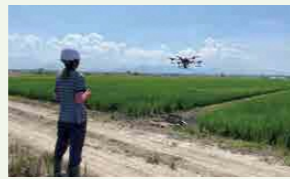
スマート農業を実践する大規模な稲作経営体

専門職大学の特徴の1つは、長期の学外実習です。学生は、2年次から4年次まで毎年30日間、目指す進路に合った実習先でリアルな農林業経営を学びます。先端技術を活用する大規模な稲作経営体や6次産業化を実践する法人、スマート林業を行う森林業事業体など、山形県、東北をリードする実習先を300カ所以上用意しています。