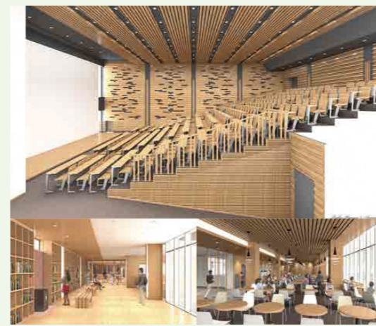
学内イメージ図 上：大講義室 右下：学生食堂 左下：ロビー

日本の農林業は、従事者の減少・高齢化やDX(デジタル・トランスフォーメーション)の進展、世界的な持続可能性への意識の高まりなど、大きな環境変化の中にあります。そのため、東北農林専門職大学では、優れた技術と経営力、国際競争力を身に付け、農林業のリーダーとなる人材の育成と、現場の課題解決・関連産業の振興に向けた研究などをを行い、農林業の持続的発展と地方創生に資することを目指します。