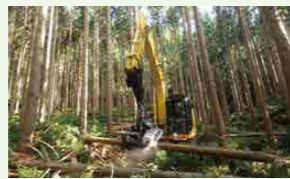
高性能林業機械を駆使する森林業事業体