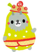
らふらん JA全農山形 園芸大国山形イメージキャラクター