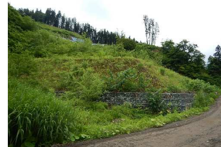
押え盛土(Aブロック)