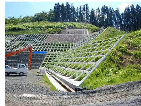
吹付法砕工(Aブロック)