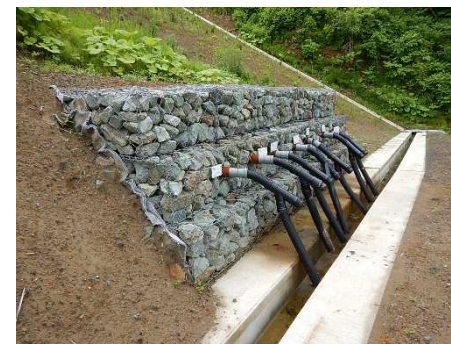
地下水排除工(Cブロック)