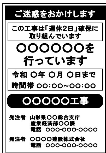
(図) 工事名標示板への明示の例