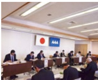
西村山・北村山地域議員協議会の様子

それぞれの地域における行政課題や施策展開について、地元選出の県議会議員が幅広く調査・審議し、さまざまな提案を行いました。