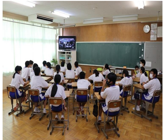
ZOOM を活用して実施した「親子人権研修」