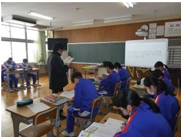
小中合同授業研究会として実施した 「いじめ」を扱った1年生の道徳の授業