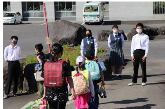
年間2回、小学校に中学生が訪問して実施 している小中あいさつ運動