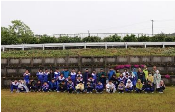
人権擁護委員会の方に来校いただき実施した 「人権の花」の植栽活動