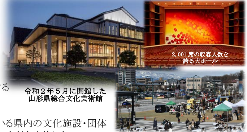
令和2年5月に開館した山形県総合文化芸術館

・文翔館では、絵葉書やクリアファイルなどのオリジナルグッズの作成・販売など認知度向上に向けた取組を行い、令和5年5月に入館者400万人を達成した。