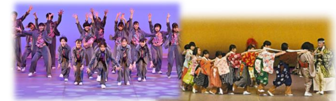
「こども郷土芸能芸術まつり」で子どもたちが日ごろの文化活動の成果を披露