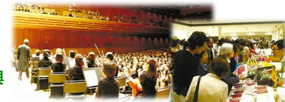
さくらんぼコンサート東京公演で山形の音楽と食をPR