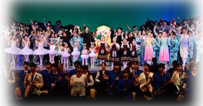
令和4年度第60回県民芸術祭記念公演