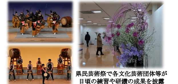
県民芸術祭で各文化芸術団体等が日頃の練習や研鑽の成果を披露