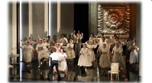
やまぎん県民ホールで東京二期会によるオペラ『フィガロの結婚』公演（R5.1）