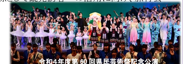
令和4年度第60回県民芸術祭記念公演