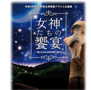
「縄文の女神」国宝指定10周年を記念したプライム企画展(令和4年)