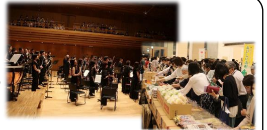
さくらんぼコンサート東京公演で山形の音楽と食をPR