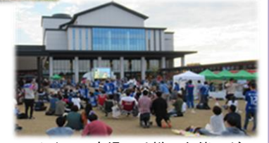
イベント広場では様々な催しが開かれ賑わいを見せている