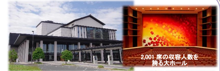
令和2年5月に開館した山形県総合文化芸術館