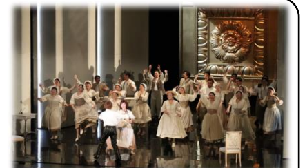
やまぎん県民ホールで東京二期会によるオペラ『フィガロの結婚』公演 (R5.1)