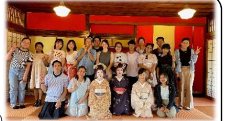
在住外国人が本県の魅力を体験（「相馬楼」での酒田舞娘の演舞鑑賞）