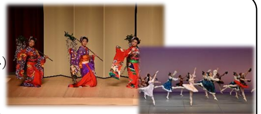
「こども郷土芸能芸術まつり」で子どもたちが日ごろの文化活動の成果を披露