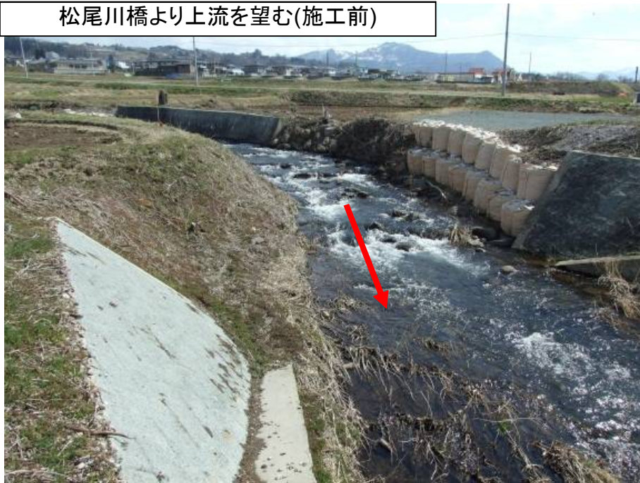
松尾川橋より上流を望む(施工前)