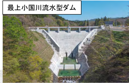
最上小国川流水型ダム

広域連携事業により、県が民間及び地元自治体と一体的に整備を行い、最上小国川沿川の集客を目指す。民間企業が設置するキャンプ場と共に、展望広場や桜並木を整備し、全国でも数が少ない(全国で5箇所・東北唯一)流水型ダムを観光資源としての効果を更に高めて広域からの来訪者の増加を図る。