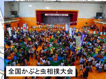
全国かぶと虫相撲大会