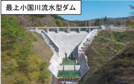
最上小国川流水型ダム

広域連携事業により、県が民間及び地元自治体と一体的に整備を行い、最上小国川沿川の集客を目指す。民間企業が設置するキャンプ場と共に、展望広場や桜並木を整備し、全国でも数が少ない(全国で5箇所・東北唯一)流水型ダムを観光資源としての効果を更に高めて広域からの来訪者の増加を図る。