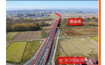
道路改築事業の例（国）287号 豊穰橋（米沢市）