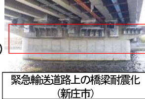
緊急輸送道路上の橋梁耐震化（新庄市）

公共土木施設の耐震化をはじめとした長寿命化対策（点検、補修、更新）、緊急自然災害防止対策事業債を活用した、劣化状況に応じた効果的な道路舗装のメンテナンスの実施