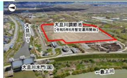
河川整備（大且川/村山市）