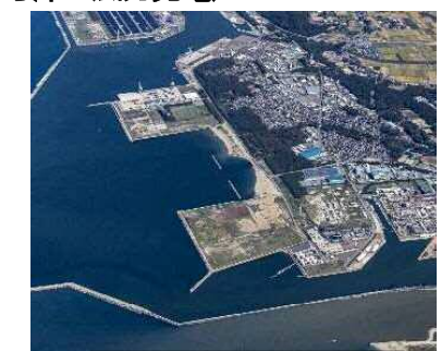
酒田港の整備（酒田市）