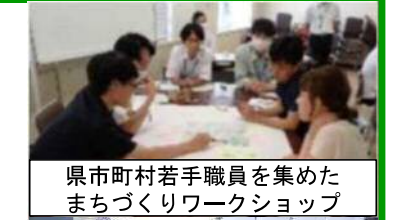
県市町村若手職員を集めたまちづくりワークショップ