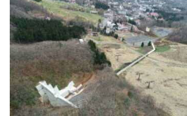
砂防施設（人家、避難所の保全）