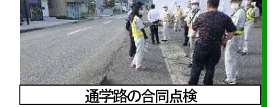
通学路の合同点検