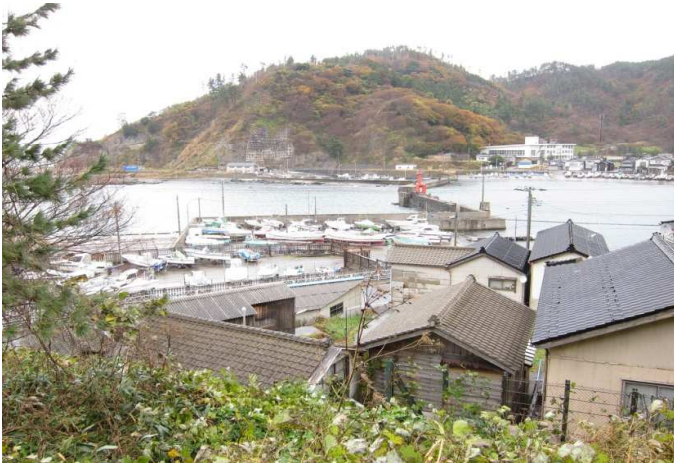
No 2 鶴岡市加茂地区のまちなみ