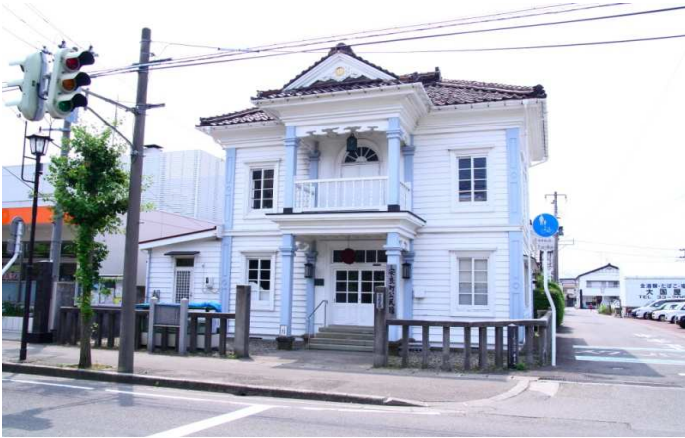
No 2 新民館（旧大山小学校校舎）