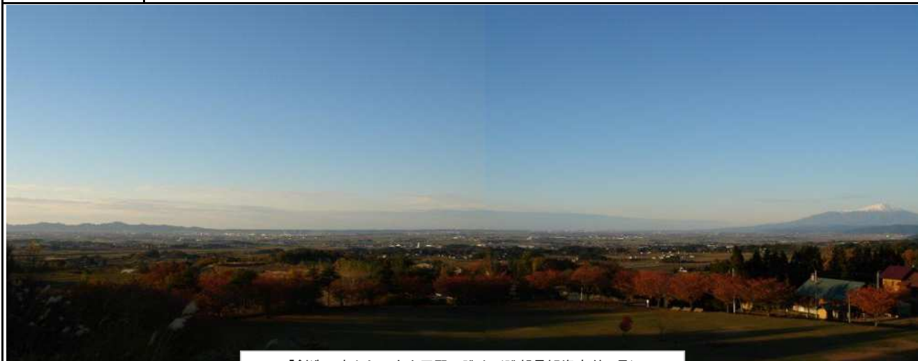
「創造の森からの庄内平野の眺め」(眺望景観資産 第1号)