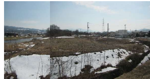
片谷地地区 (常盤橋左岸上流) 進捗状況 (令和7年2月撮影)