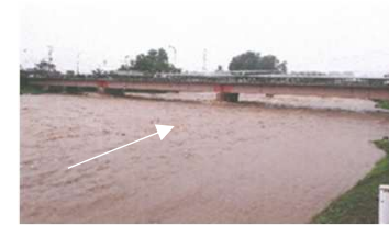
令和2年7月豪雨時の状況 (常盤橋付近)