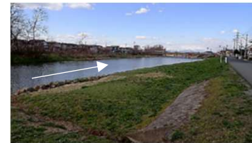
事業着手前の状況 (常盤橋上流付近)