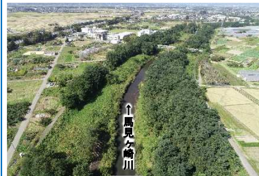
整備前の状況 (全景)