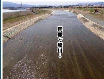
整備状況 (天神橋付近)