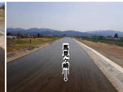
整備状況 (新川樋門付近)