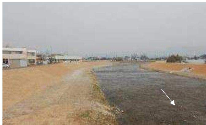
整備状況 (北柳橋付近)