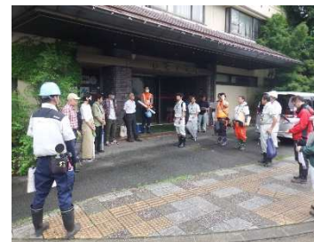
用地境界立会い (令和6年7月)