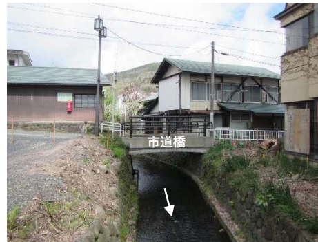
用地調査 (市道橋上流側)