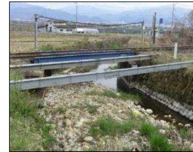
J R 左沢線橋梁付近