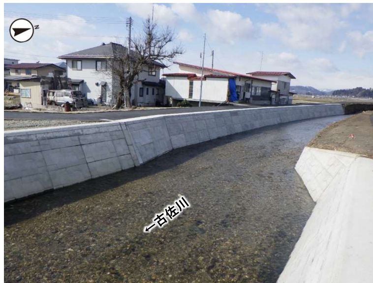
河川整備状況（R6.3月撮影）