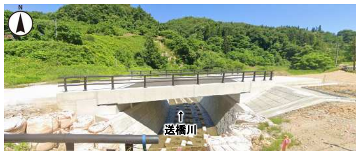
要害橋架替（令和5年6月撮影）