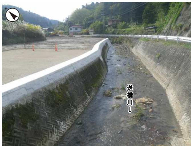
河川整備状況（令和5年10月撮影）