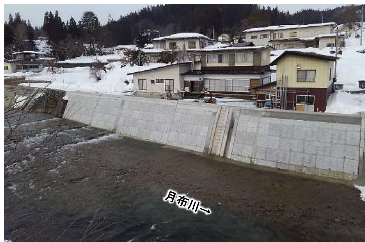
貫見地区（令和5年1月撮影）