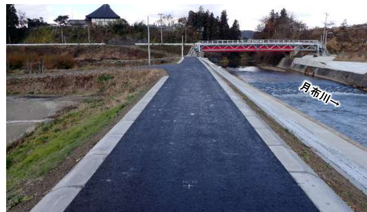
荻野地区（令和4年11月撮影）