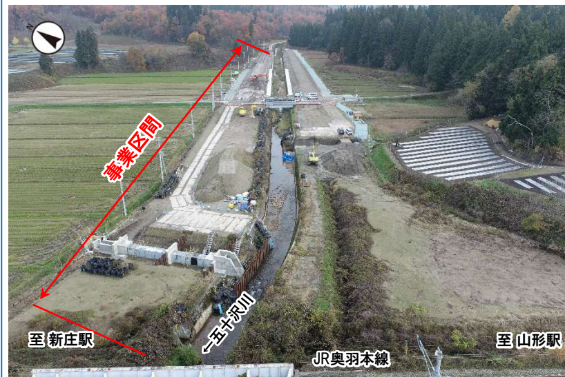
河川整備状況 (令和6年11月撮影)