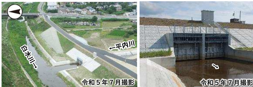
平内川排水樋門整備状況