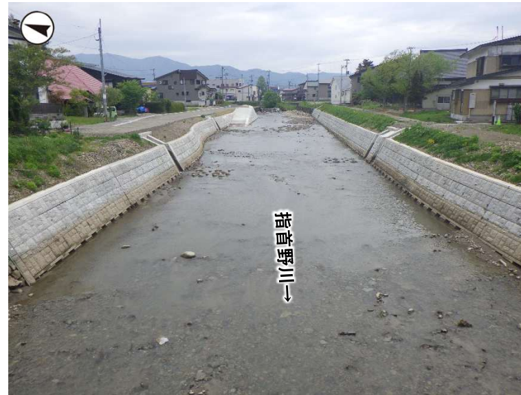
河川整備状況 (令和6年4月撮影)