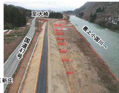
整備状況 (令和5年3月撮影)