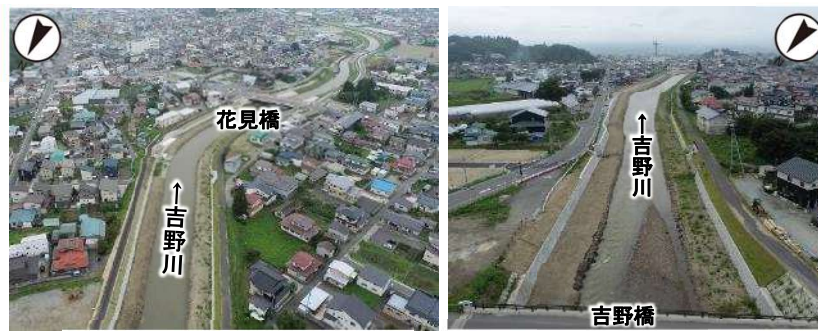
花見橋付近 (R3年8月撮影)