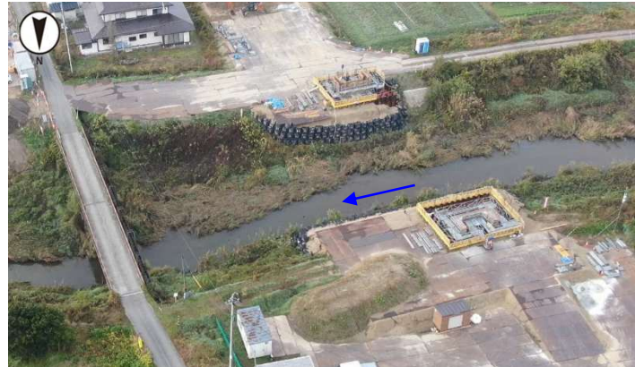
橋梁架設工事中 (中瀬橋) 令和6年11月