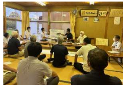
事業説明会 (令和5年7月)