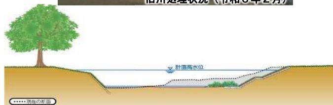
河川整備計画断面図