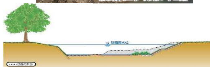
河川整備計画断面図