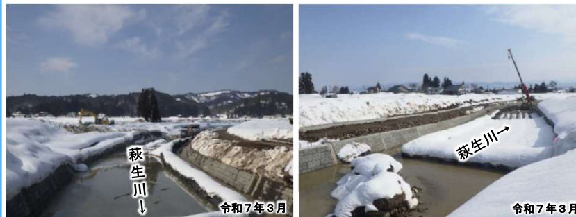
施工中区間の状況