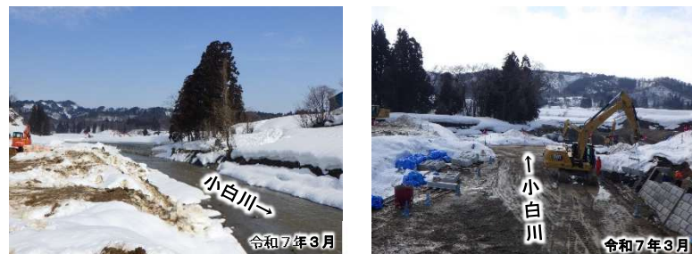
施工中区間の状況