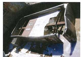
落下した看板(イメージ)

老朽化している看板に気付いたときは、事故につながる可能性がありますので、下記担当課までご連絡をお願いします。