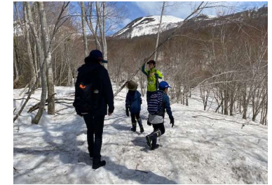
県立自然博物館インタープリター