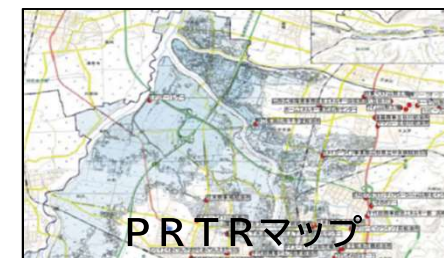
P R T Rマップ