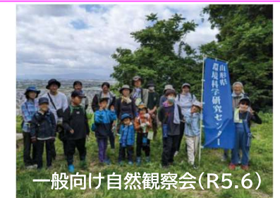
一般向け自然観察会(R5.6)