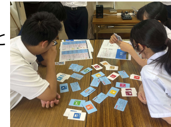
米沢興譲館高校でのSDGsWS