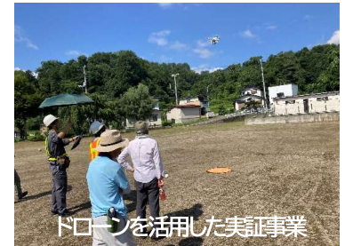
ドローンを活用した実証事業