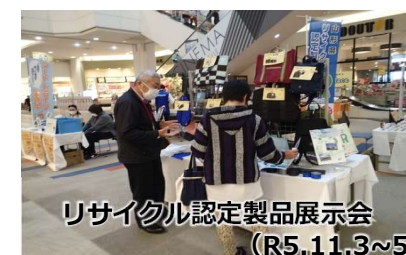
リサイクル認定製品展示会 (R5.11.3～5)