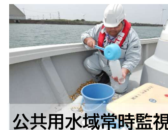
公共用水域常時監視