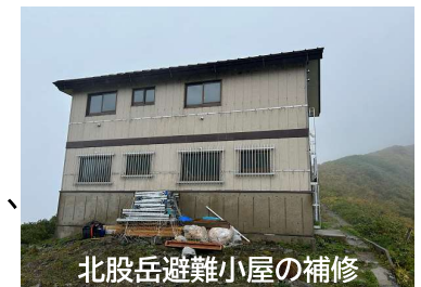
北股岳避難小屋の補修