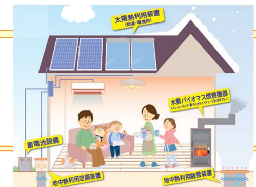
みら やまがた未来くるエネルギー補助金 対象設備