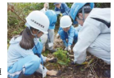
オオシラビソの稚樹の移植