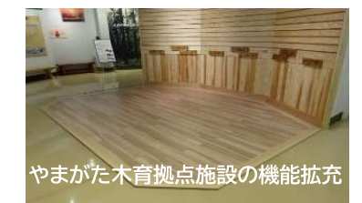
やまがた木育拠点施設の機能拡充