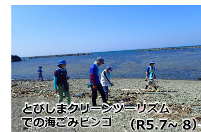
とびしまクリーンツーリズム での海ごみピンゴ (R5.7～8)