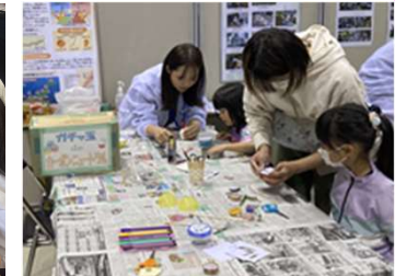
やまカボ・サポーターによるリサイクル工作教室