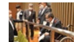
身障者用傍聴スペース実地調査