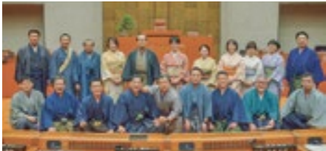
着物姿で本県の伝統産業をPR

令和6年度一般会計予算案については、3月14日、知事から「さくらんぼを核とした県産フルーツ情報発信事業費」の事業内容を見直すため撤回したい旨の申し出があり、同月15日の本会議で承認しました。その後、同事業を除いた予算案が再提出され、全会一致で可決しました。