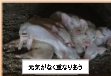
元気がなく重なりあう