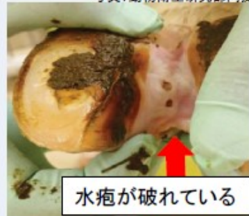
水疱が破れている