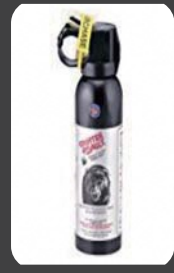
クマ撃退スプレー

④ 万一、クマに出合ったら、背を向けずに、ゆっくり後退してください。(クマ撃退スプレーの使用も有効です。)