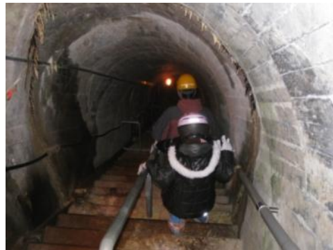
▲ホラー映画の撮影現場となった監査廊