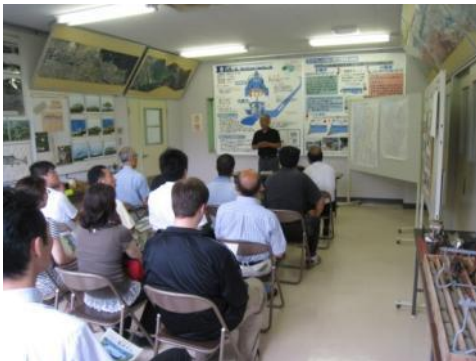
▲資料室での説明風景