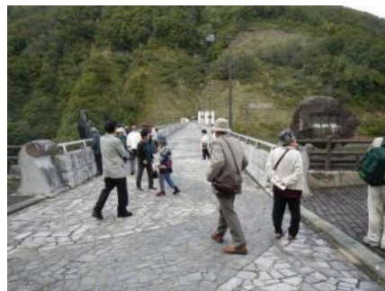
▲ダム天端見学の様子