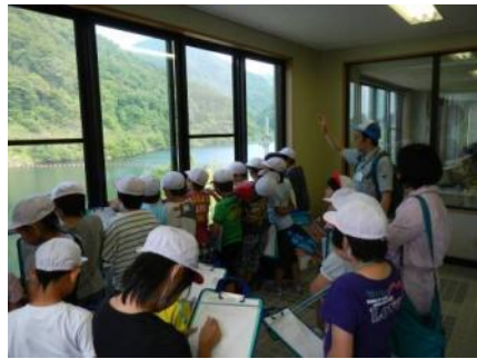
▲展望室で概要を説明