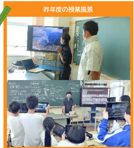
昨年度の授業風景