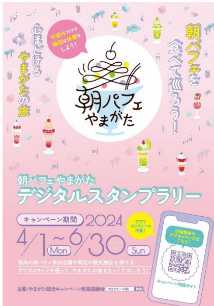
(例)漆山果樹園のパフェ