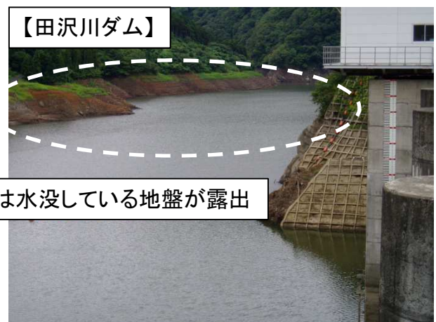
【渇水時:平成27年8月31日状況】 貯水位:EL.117.6m 貯水率:43%