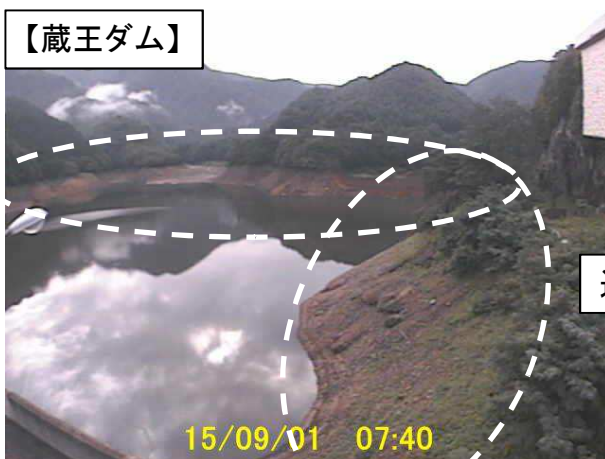
【渇水時:平成27年9月1日状況】 貯水位:EL.584.2m 貯水率:47%