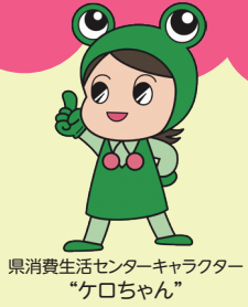
県消費生活センターキャラクター 「ケロちゃん」

若年者を狙った悪質商法が後を絶ちません。若年者がトラブルにあうことを未然に防ぐためにも、悪質商法の手口を知り、いざというときは冷静に対処しましょう。