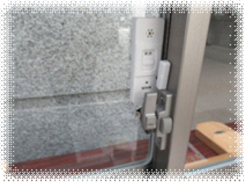
マグネットセンサー